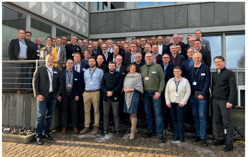
Sitzung der AMK-Arbeitsgruppe Technik & Normung AM 30. NOVEMBER 2023 BEI HETTICH