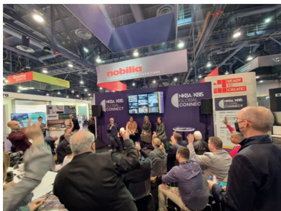
TALKRUNDE IM RAHMEN DER KBIS 2023 IN LAS VEGAS

Obwohl der heimische Markt nach wie vor von zentraler Bedeutung für die deutsche und europäische Küchenindustrie ist, gewinnen ausländische Märkte von Jahr zu Jahr wieder an Relevanz. Insbesondere der europäische Markt ist bereits gut erschlossen, jedoch