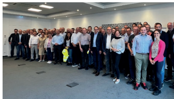
Sitzung der AMK-Arbeitsgruppe Technik & Normung AM 7. JUNI 2023 BEI NOBILIA

nisse der Projektteams finden ihren Niederschlag in den AMK-Merkblättern sowie in weiteren AMK-Unterlagen wie der AMK Aufmaß-Checkliste und der AMK-Entscheidungshilfe „Luftführung von Kochfeldabzügen“ (1. Ausgabe – Oktober 2023). Die AMK-Merkblätter sind seit Jahrzehnten eine bestens bewährte und wichtige Orientierungshilfe für Küchenplaner, Küchenhändler, Küchenmöbelhersteller, Gerätehersteller, Monteure und Zulieferer. Sie bilden ferner die Grundlage der Arbeit von Sachverständigen bei der Erstellung von Gutachten. Die AMK-Merkblätter unterliegen einer kontinuierlichen Revision und spiegeln damit den Stand der Technik wider. Die Mitglieder der AMK-Arbeitsgruppe Technik & Normung leisten Grundlagenarbeit und machen vieles erst möglich, was den Profis in der Küchenbranche ganz selbstverständlich erscheint: koordinierte Einbaumaße, Behebung von Schnittstellenproblemen sowie die Definition von Qualitätsanforderungen und Prüfverfahren sind nur einige Beispiele hierfür.