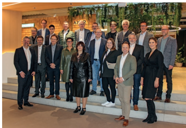
ARBEITSGRUPPENSITZUNG AM 20./21. NOVEMBER 2023 BEI HANSGROHE IN SCHILTACH

Als weiteren zentralen Themenbereich wurde das Thema Nachhaltigkeit behandelt. Sie wird in den nächsten Monaten und Jahren noch weiter an Bedeutung, auch für unsere