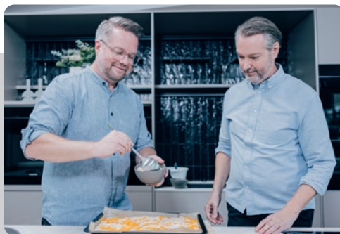
INFLUENCERTALK MIT HOUSE_OF_PETER_AND_KARSTEN