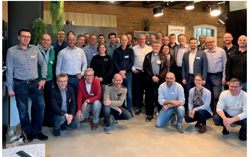
AMK-WORKSHOP „GESCHIRRSPÜLER“ AM 20./21. MÄRZ 2023 BEI BAUKNECHT AUF GUT BÖCKEL IN RÖDINGHAUSEN