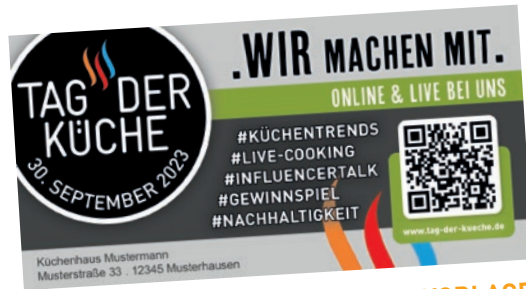
ANZEIGENVORLAGE FÜR HÄNDLER