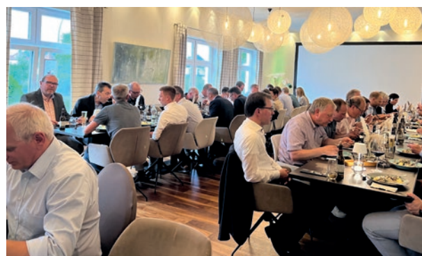
Sitzung der AMK-Arbeitsgruppe Technik & Normung GEMEINSAMES ABENDESSEN AM 6. JUNI 2023