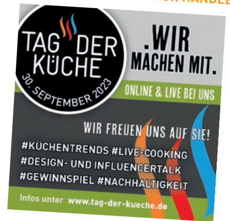
INSTAGRAMVORLAGE FÜR HÄNDLER