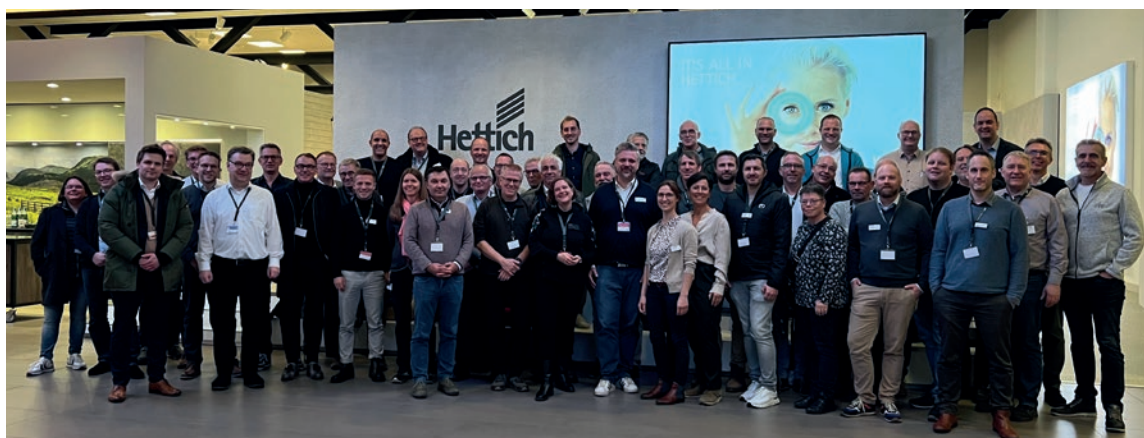
Sitzung der AMK-Arbeitsgruppe Technik & Normung

WERKSFÜHRUNG BEI HETTICH UND BESICHTIGUNG DES HETTICH FORUM AM 29. NOVEMBER 2023 IN KIRCH- LENGERN