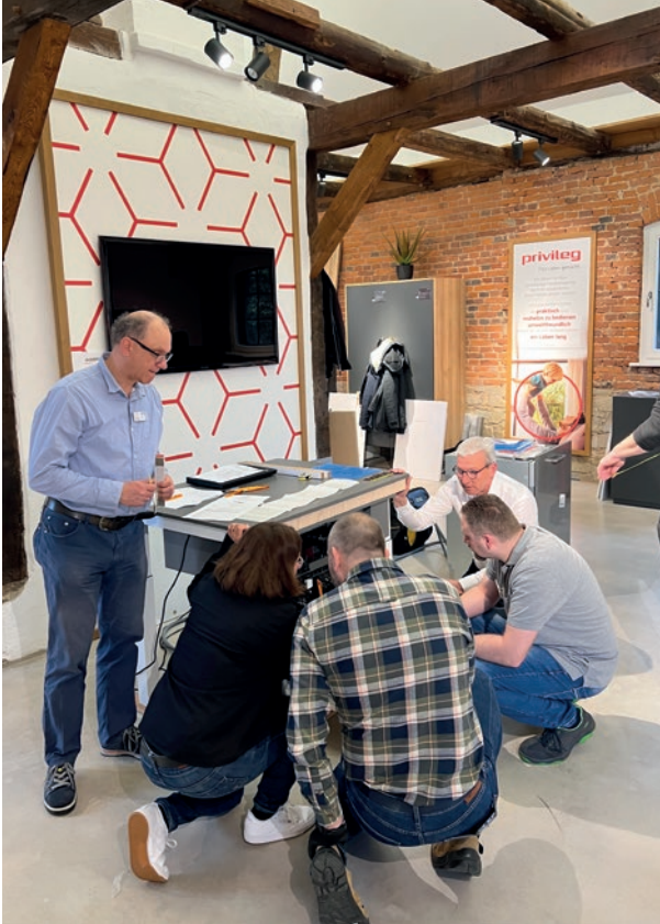
AMK-WORKSHOP „GESCHIRRSPÜLER“ AM 20./21. MÄRZ 2023 BEI BAUKNECHT AUF GUT BÖCKEL IN RÖDINGHAUSEN