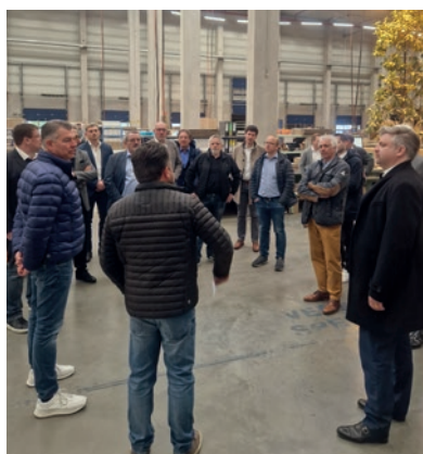
ARBEITSGRUPPEN- SITZUNG AM 19./20. APRIL 2023 UND WERKSFÜHRUNG BEI NABER IN NORDHORN

Im Jahr 2012 wurden die beiden Arbeitsgruppen Spülen und Zubehör zu einer gemeinsamen Arbeitsgruppe Spülen & Zubehör verschmolzen – eine Entscheidung, die dazu diente, den Produkten und der Arbeitsgruppe größere Aufmerksamkeit zu schenken, auch außerhalb der AMK. Die Wichtigkeit des Küchenzubehörs und der Spülen für die modernen Einbauküchen nimmt jährlich an Bedeutung zu. Das Küchenzubehör ist eine zentrale Komponente der modernen und körpergerechten Küche. Sie bietet für den Handel Wert und für den Verbraucher Nutzen.